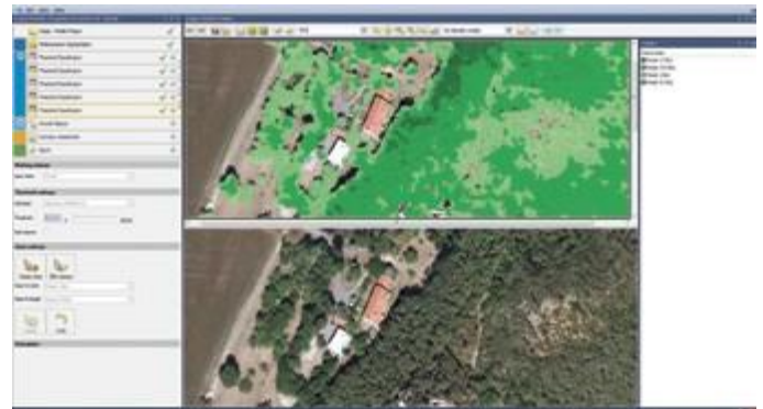
eCognition Essentials Forest Mapping